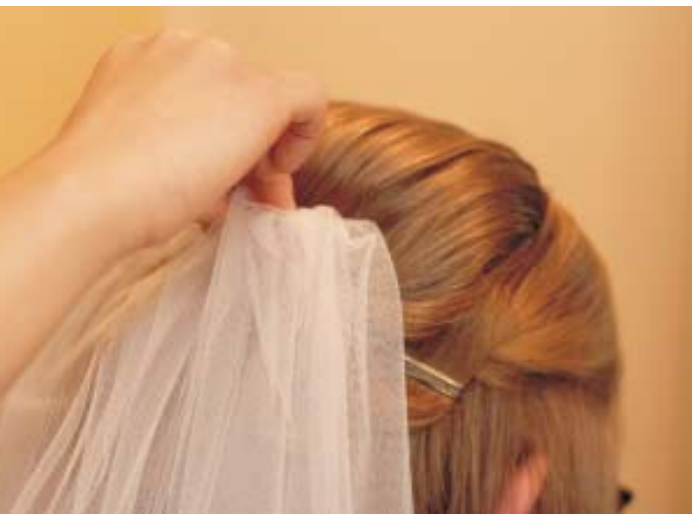
Przypięcie welonu to jeden z najważniejszych akcentów przygotowań ślubnych (Canon EOS 350D, obiektyw EF 50/1,4 USM, f 2,2, 1/60s, ISO 400).

Głównymi akcentami są takie atrybuty jak muszka czy krawat, zwłaszcza chwila ich zakładania, buty, pan młody w kamizelce bez marynarki czy bukiet kwiatków w butonierce. Również portret grupowy ze świadkiem czy ojcem stanowią klasyczny kanon zdjęć z przygotowań do uroczystości ślubnych.