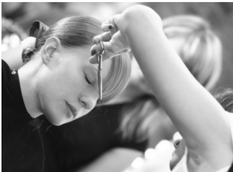
Ciekawie wychodzą zdjęcia czarno-białe, ale nie można tej techniki nadużywać (Canon EOS 350D, obiektyw EF 18–55/3,5–5,6, 1/60s, ISO 400).

Panna młoda rzadko przygotowuje się sama. Najczęściej towarzyszą jej drużyny, rodzina lub zawodowa fryzjerka, manicurzystka czy kosmetyczka. Ciekawe są ujęcia przedstawiające osoby przygotowujące młodą do swojej roli.