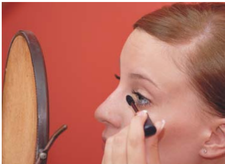
Makijaż – wdzieczny temat dla fotografa (Canon EOS 350D, obiektyw EF 18–55/3,5–5,6, 1/200s, ISO 800).

wykorzystanie jaśniejszej optyki, nawet stałoogniskowej, jak np. 50/1,8 oraz zastosowanie wyższej czułości. W czasie wykonywania zdjęć przygotowań bardzo przydatny będzie ekran rozświetlający cienie (o którym pisano w rozdziale 4. Osprzęt). Ostatni parametr, który nastawiany jest w aparatach cyfrowych, to balans bieli. Dobrze jest skorzystać z ustawienia wzorcowego na białej karcie, ale przy zdjęciach bez użycia lampy błyskowej przełącznik balansu bieli w aparacie fotograficznym można ustawić na ikonę żarówki, natomiast gdy używana jest lampa błyskowa, przełącznik ten powinien być ustawiony na