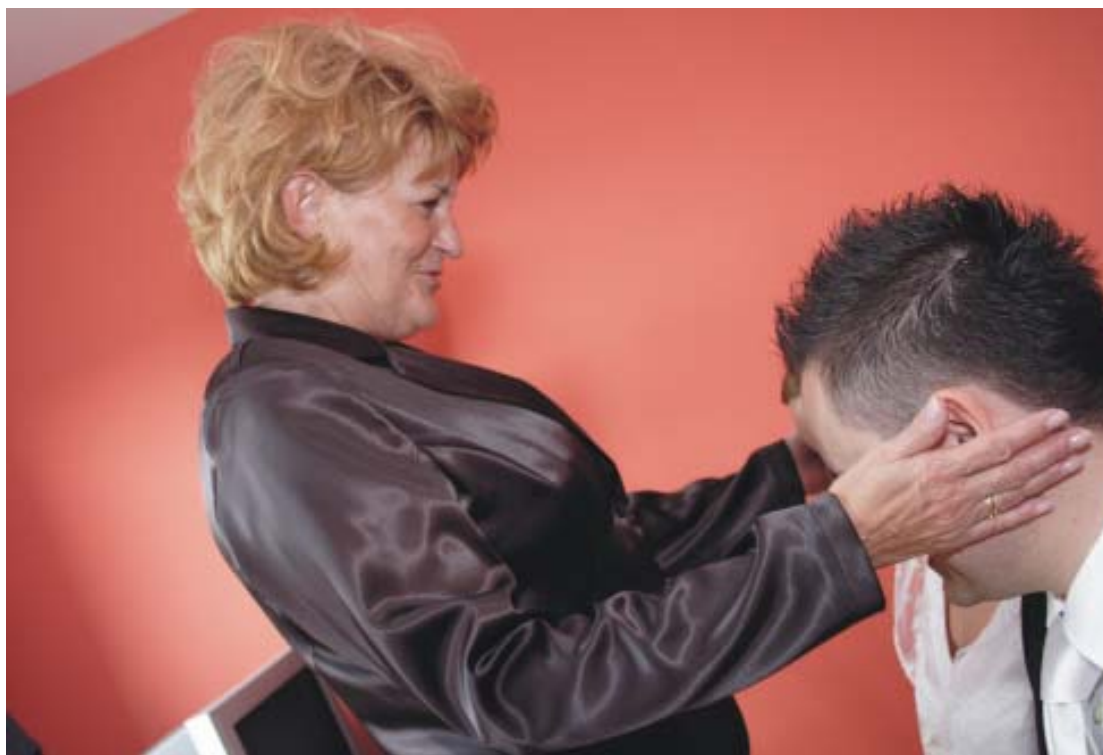
Błogosławieństwo w niektórych rodzinach udzielane jest przez rodziców przed wyjściem z domu do świątyni (Canon EOS 350D, obiektyw EF 18–55/3,5–5,6, ogniskowa 24 mm [ekwiwalent 37 mm], f 4,5, 1/60s., ISO 800).

Ale jeżeli czas i organizacja imprezy pozwalają na wykonanie kilku zdjęć, to pewnie zamieszanie towarzyszące wyjazdowi orszaku z domu jest okazją do kilku ciekawych ujęć reportażowych.